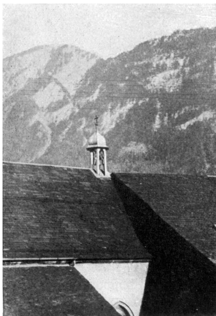
Clocheton du XVIII e siècle remplacé par une flèche en 1948

Professeur à l'Ecole Polytechnique fédérale Président de la Commission fédérale des Monuments historiques