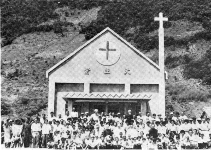
Cliché Le Nouvelliste , Saint-Maurice