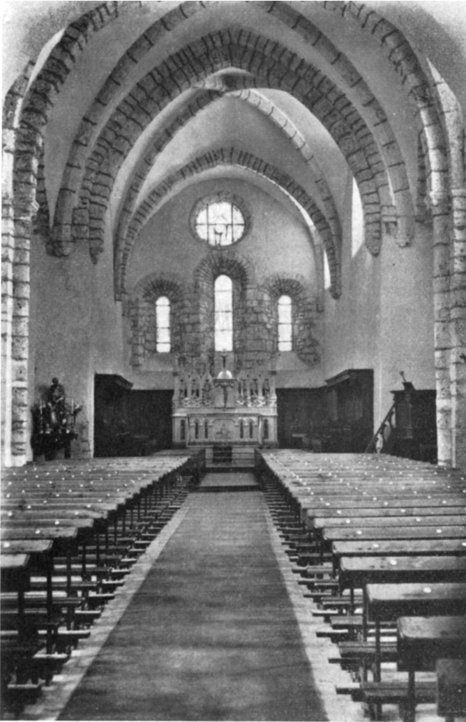
Eglise de Sixt en Haute-Savoie