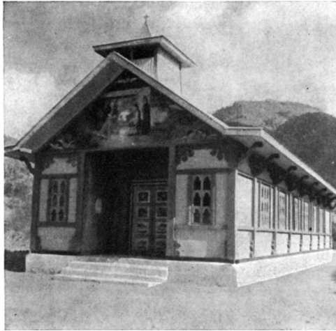
L'église de Suruk construite par Mgr Gianora dans le style d'un temple lepcha

jusqu'à la fin du XVIII e siècle, mais la Révolution la supprima en 1793. Ses bâtiments existent encore et son église est devenue l'église paroissiale.