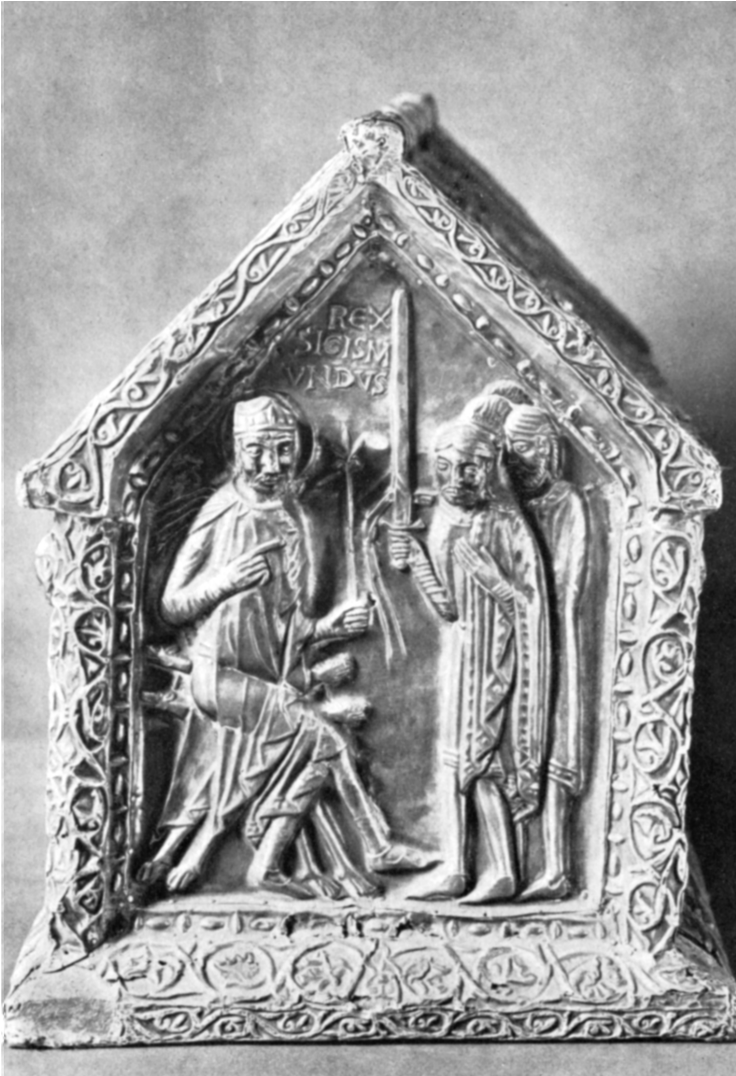
S. Sigismund reçoit l'hommage de ses comtes (XII e siècle, Trésor de l'Abbaye)