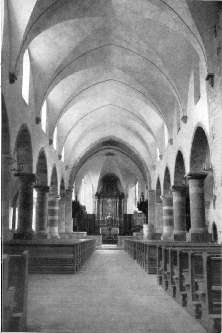
Intérieur de la Basilique de Saint-Maurice