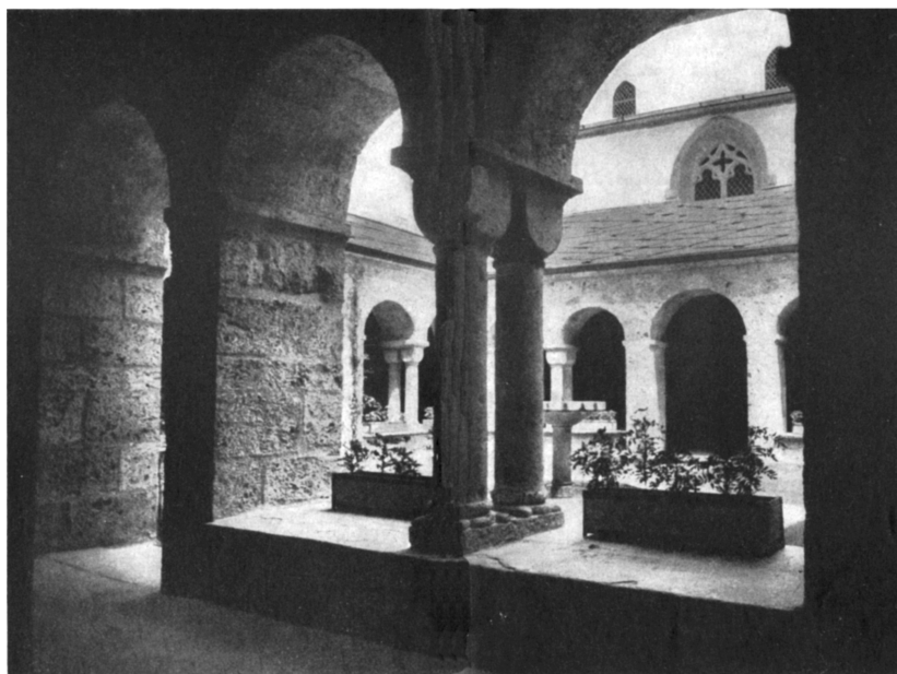
Au cœur de l'Abbaye, adossé à la Basilique : le cloître