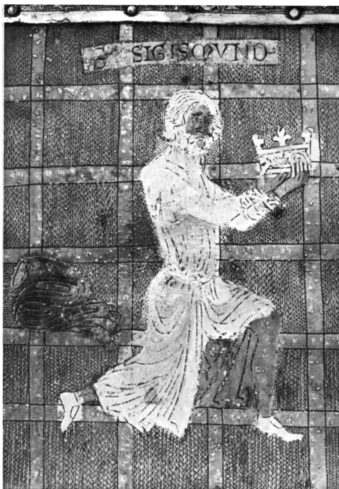
S. Sigismond offre sa couronne à S. Maurice (Châsse de Nantelme, 1225, Trésor de l'Abbaye)