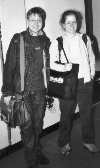
Merci pour le sourire !

tar des usages universitaires pratiqués dans ce pays, un débat opposa un défenseur des valeurs républicaines et un partisan de la tradition monarchique. Les élèves présents se sont prononcés sur la place de ce régime politique : en pays