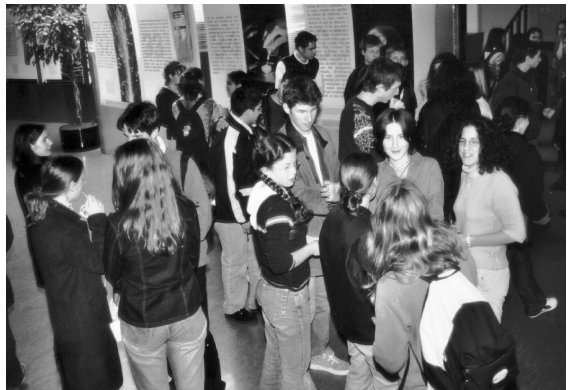
Pendant la pause, à l'intérieur...

La Grande-Bretagne sans sa Famille royale serait-elle ce qu'elle est ? À l'ins-