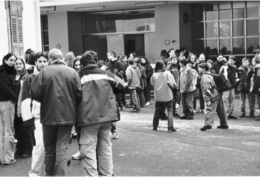
Pendant la pause, dehors...

du Collège a tenu à lui montrer son admiration. Le Testament du Haut-Rhône , œuvre très forte de Chappaz, a fait l'objet d'une lecture publique à laquelle de nombreuses classes purent assister en première audition. Lors de la journée officielle, Maurice Chappaz a rappelé à une assistance subjuguée avec quelle intériorité il fallait lire son texte : son intervention fut un moment de grâce.