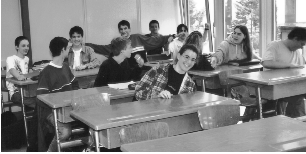
La classe de 2 E Sciences.