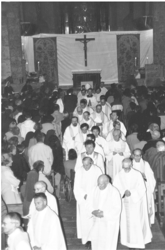
Procession de sortie de la messe pour les vocations. Le chœur de la Basilique est masqué par les échafaudages nécessaires à la réfection des stalles.