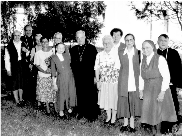
L'Abbaye prend congé de la communauté des sœurs de Saint-Jacques.

La fête de saint Augustin, que nous aimons appeler notre bienheureux Père, nous est chère, mais cette année à nouveau la contrainte du programme scolaire nous oblige à l'anticiper au samedi précédent. Les confrères des paroisses viennent nombreux à la messe solennelle, faisant de ce jour une fête de fa-