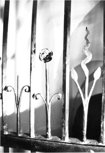
Une partie du jardin fleuri.

rite épanouie, séparées par une tige à deux feuilles stylisées en volutes comme toutes les feuilles de la grille.