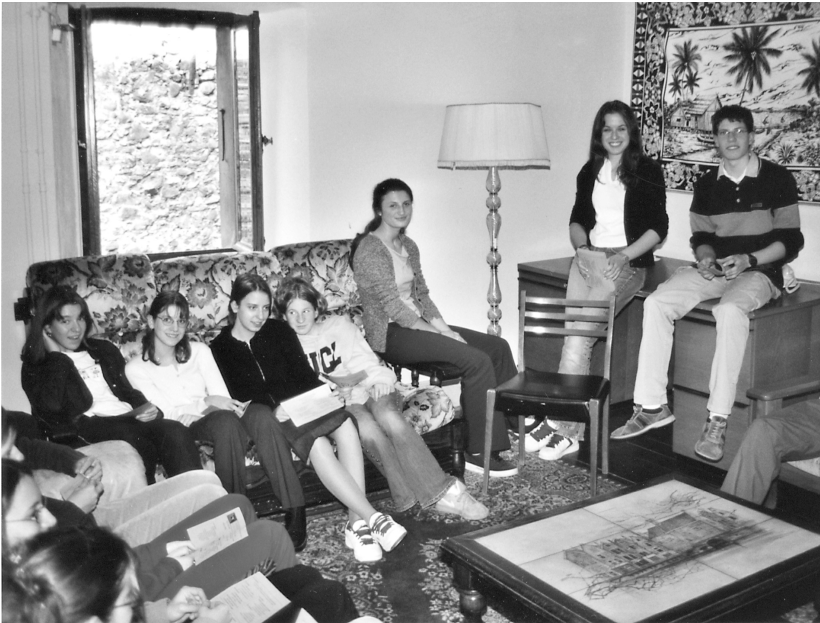
Pendant la pause...

Transmettre un message humaniste reste la vocation du collège. Les activités culturelles concourent à réaliser cet