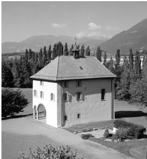
La chapelle de Vérollez est bâtie sur le lieu traditionnel du martyre de saint Maurice et de ses Compagnons.

Une fois donc les Alpes franchies, Maximin César vint à Octodure et, dans l'intention d'y offrir un sacrifice