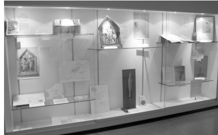
Une des vitrines de l'exposition de la semaine médiévale.