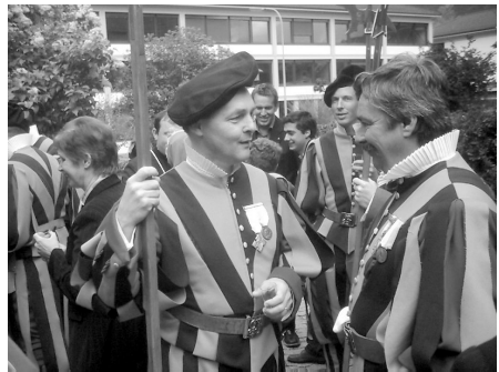
Les Gardes suisses à l'heure de l'apéritif!

La messe pontificale de 10 heures est marquée par la présence d'une vingtaine de Gardes Suisses du Vatican, haut-valaisans pour la plupart: leur assemblée annuelle se tenant à Saint-Maurice, c'est pour eux l'occasion de venir à la basilique. Ils se tiennent dans le sanctuaire, majestueux avec leurs costumes striés de bandes jaune et bleu et leurs halberdes. Mgr Roudit s'adresse à eux en allemand au cours de son homélie, et à la fin de la messe, l'un d'eux prononce une belle prière.