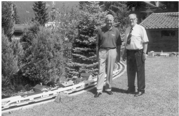
A Villars, devant le petit train installé sur le pré de la cure.