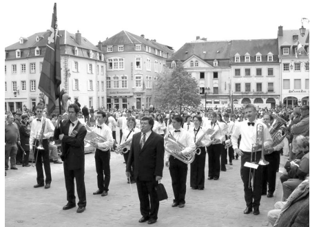
La fanfare du collège au départ de la procession dansante d'Echternach.

Les prestations habituelles de l'Orchestre du Collège, de la Fanfare et du Chœur sont toujours appréciées. La tradition musicale de Saint-Maurice se perpétue. En participant au mois de mai à la procession dansante d'Echternach, au Luxembourg, la Fanfare du Collège a su être à la hauteur de cet événement.