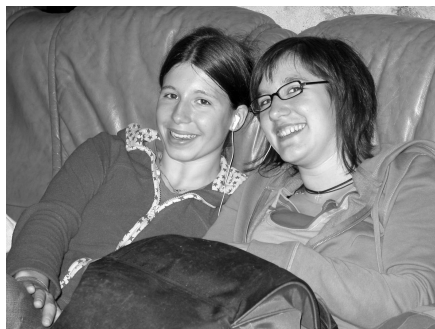
Deux étudiantes à l'heure de la pause.

ce projet prend corps. Les professeurs s'investissent depuis quelques mois dans la préparation de cet événement. Le but est d'offrir l'image d'une institution vivante, s'inspirant des valeurs humanistes et résolument tournée vers l'avenir.