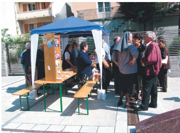
Le samedi suivant la « nuit des couvents », les communautés religieuses de Saint-Maurice ont tenu un stand au marché de la ville. L'occasion de belles rencontres...

Dans la soirée du 5 mai, une « nuit des couvents » est organisée dans toute la Suisse pour permettre aux laïcs de connaître de l'intérieur les communautés religieuses tout en priant pour les vocations. Bon nombre d'entre