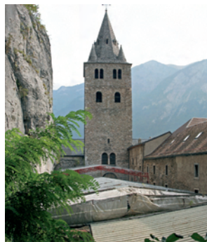
Le Martolet avant les travaux.

Le mardi 14 avril à 10 heures, Mgr Joseph Roudit, accompagné du Conseiller d'Etat Jean-Jacques Rey-Bellet, a béni la première poutre de la nouvelle toiture suspendue qui protégera bientôt définitivement le site.